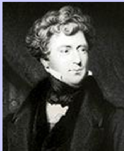
JAMES BLUNDELL 1790-1878

2- " GRAVITATOR " DONDE SE SUSTITUÍA LA JERINGA IMPULSORA POR LA GRAVEDAD (EL DONANTE SE SITUABA 1 METRO MÁS ALTO QUE EL RECEPTOR).