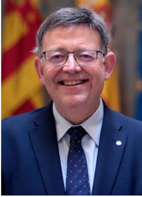
Ximo Puig President de la Generalitat Valenciana